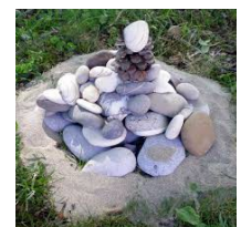
Le cairn, trouver l'équilibre...